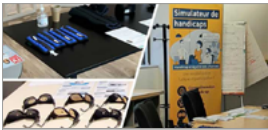
Simulateur de handicaps

DYSLEXIE DYS CALCULIE TROUBLES DYS DYSORTHOGRAPHIE DYSPHASIE DYS PRAXIE