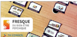
Fresque du bien-être psychique