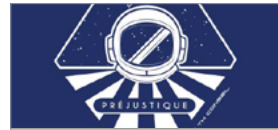
Escape Game « Préjustique »