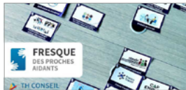
Fresque des proches aidants